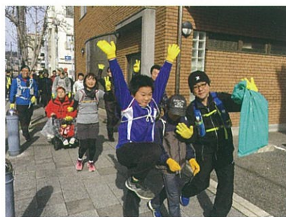
(写真はGPSランイベントの様子)

ご自宅にお送りしたキットを使って ゆめ・まちオリジナルの 動画クイズに挑戦! 地図上で上手に絵が描けるかな?