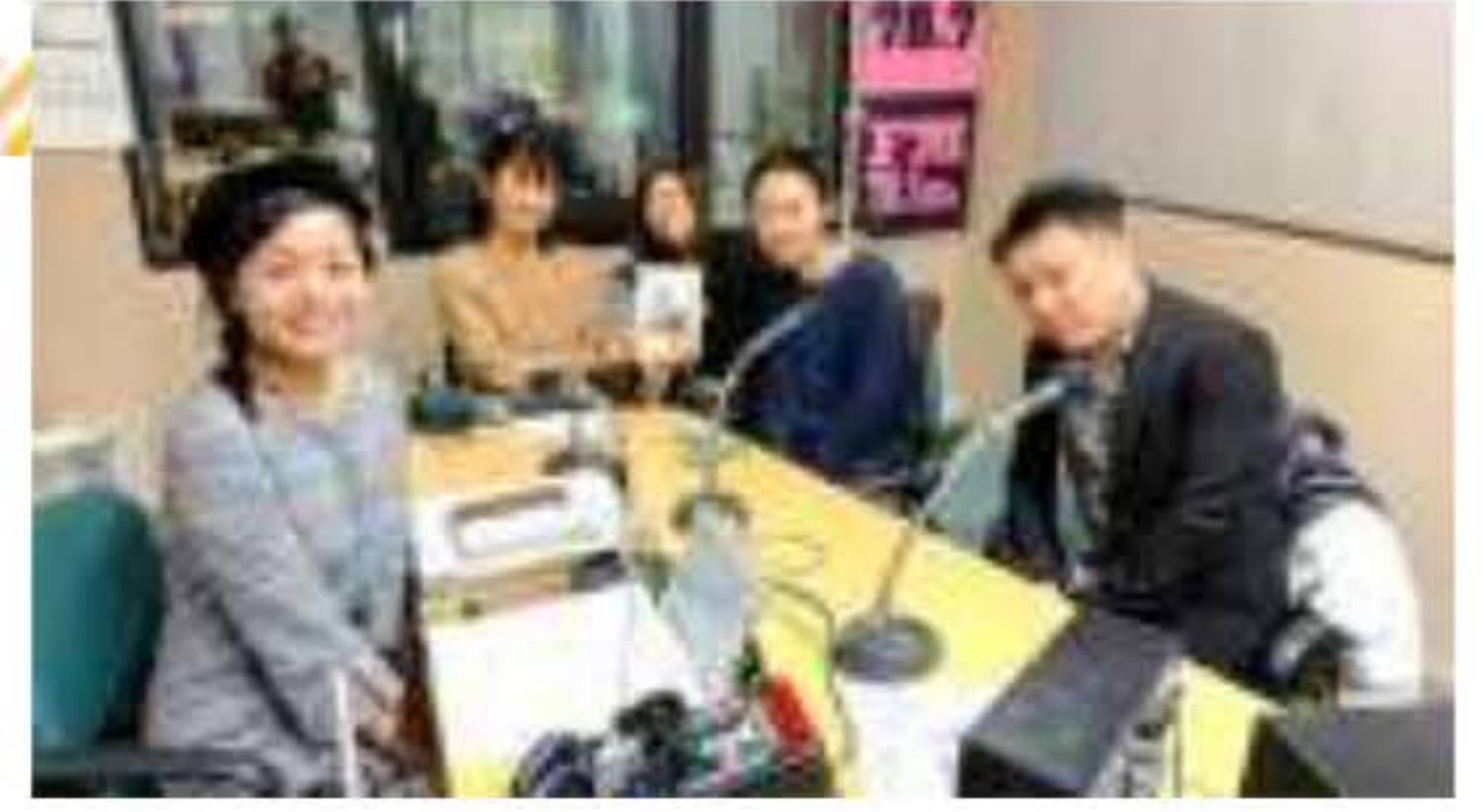
▲12/18 さくら FM 初出演！お疲れ様でした♪