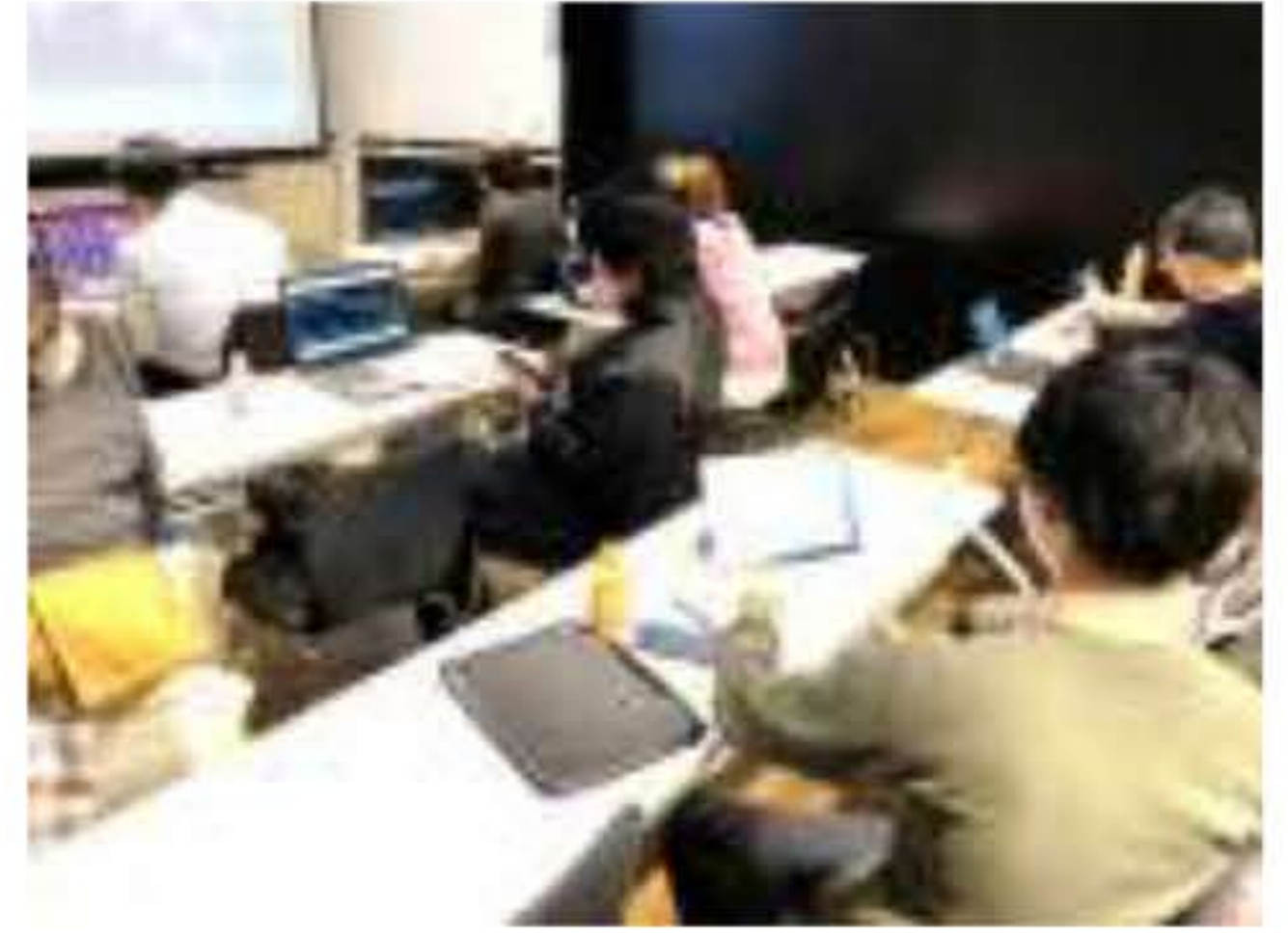
▲初心者から経験のある方まで、親身に指導